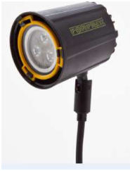
Sarja 61 3W 324lm 5700K Flood 36° 61,1,036,1,

Led-Light sarja Valaisimet mittojen mukaan